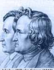
Jakob u. Wilhelm Grimm (1843)

Die Bilderwelt der Märchen gibt Einblick in die Vielfalt der unterschiedlichen Interpretationen zu den Märchentexten der Brüder Grimm. Gemeinschaftsveranstaltung mit dem Verein der Bibliophilen und Graphikfreunde Magdeburg und Sachsen-Anhalt e.V. „Willibald Pirckheimer“