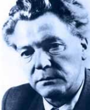
Erich Weinert 1947