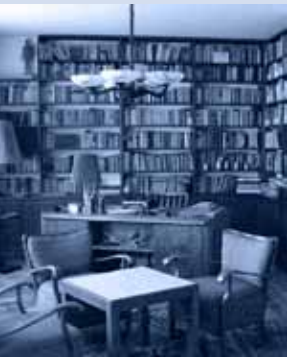
Erich Weinerts Arbeitszimmer