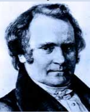
Carl Leberecht Immermann 1837