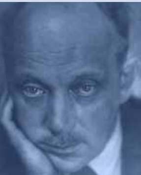
Georg Kaiser um 1940