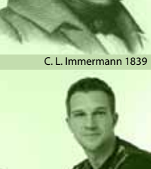
C. L. Immermann 1839

Gemeinschaftsveranstaltung mit der Literarischen Gesellschaft Magdeburg e.V.