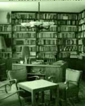
Erich Weinerts Arbeitszimmer