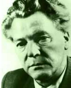
Erich Weinert 1947