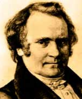
Carl Leberecht Immermann 1837