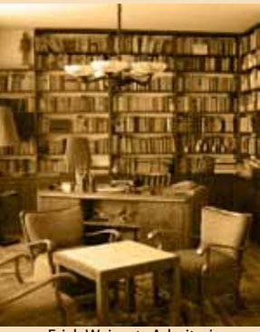
Erich Weinerts Arbeitszimmer