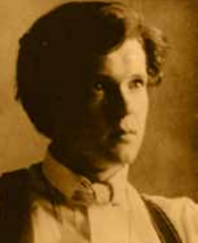
Erich Weinert 1911