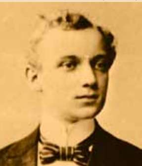
Georg Kaiser 1899